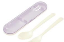
フォーク・スプーン