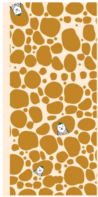
骨粗しょう症の骨 ※断面イメージ