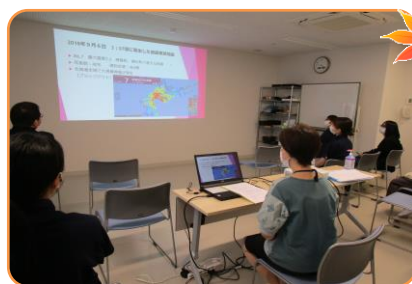
※災害対策研修会の風景